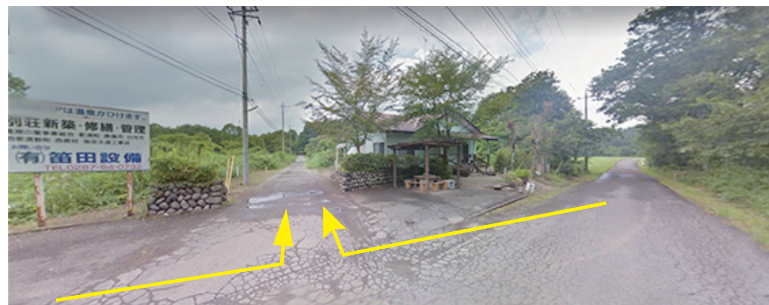
A6、Aルートからは左折