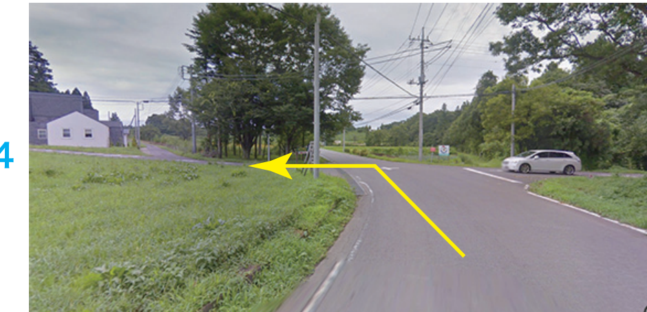
チーズ工房MANIWA FARM先を左折