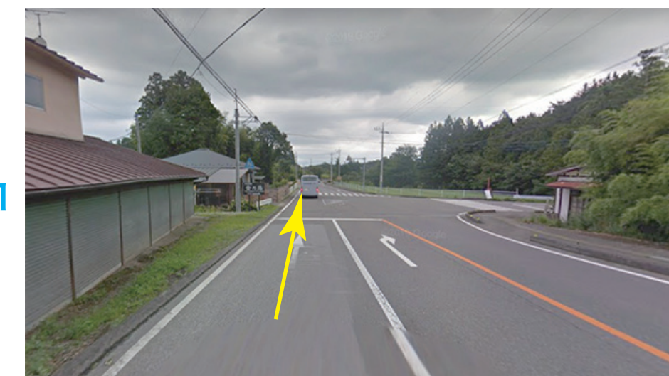
右折レーンのある所を直進後、左折