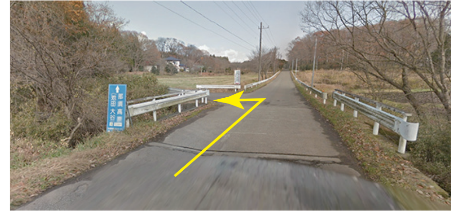
大事なポイント、左折です